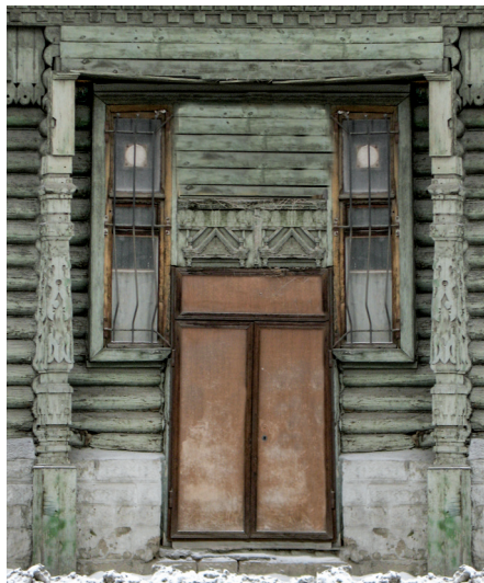
ул. Цвиллинга, 16