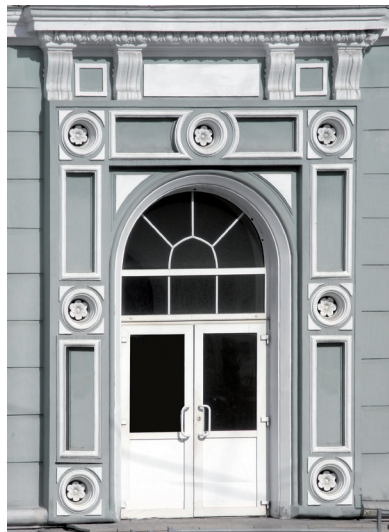
ул. Свободы, 161